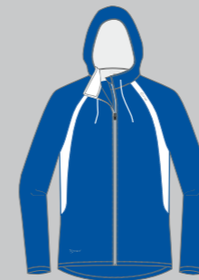
indy blue - ice white