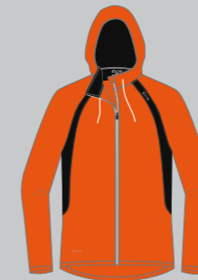
flame red - black