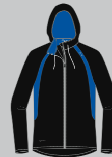
black - indy blue