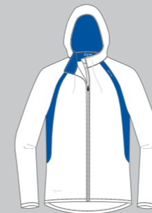
ice white - indy blue