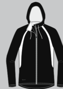
black - ice white