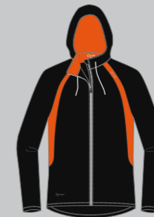
black - flame red