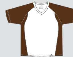
white / Nr. 1 - choco