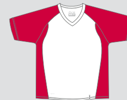
white / Nr. 1 - red / Nr. 5