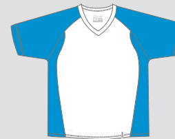
white / Nr. 1 - azurblue / Nr. 31