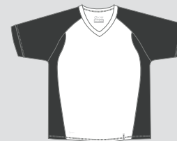
white / Nr. 1 - antrazit / Nr. 46