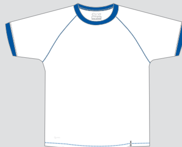
white / Nr. 1 - royalblue / Nr. 20