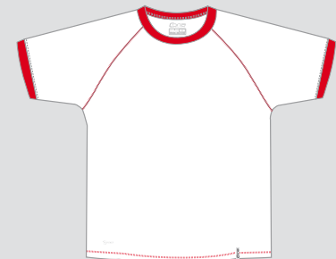
white / Nr. 1 - lobsterred / Nr. 26